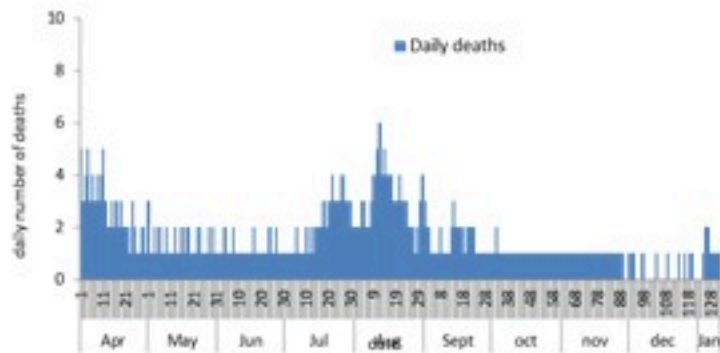
COVID-19 daily deaths