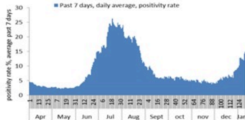
PCR positivity rate