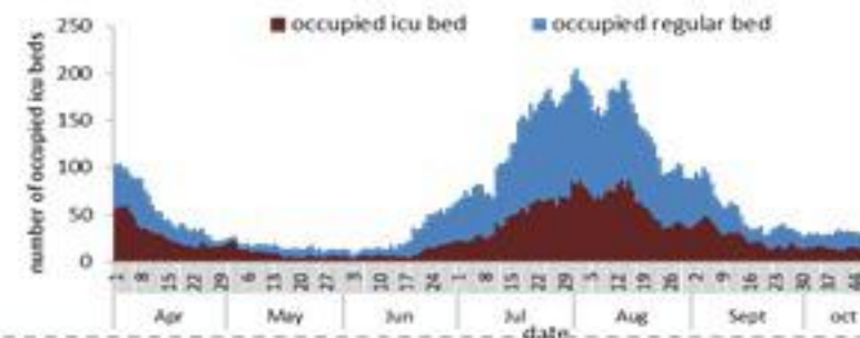
عدد الأسرة المستعملة