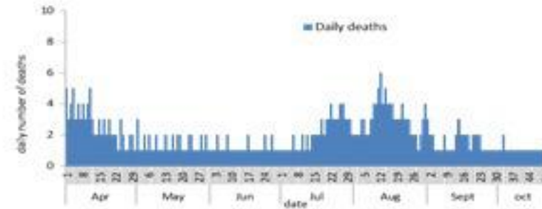
عدد الوفيات حسب اليوم

سيتم التركيز على المؤشرات الخاصة بالحالات الشديدة. في الأيام 7 الأخيرة، تم تسجيل 7 وفيات (0.13 لكل مئة ألف). وبلغت نسبة احتمال أسرة العناية الفائقة 12% (21 أسرة من أصل 182). أما نسبة إيجابية الفحوصات المحلية فقد بلغت 5.1%. ويصنف التفشي المجتمعي على مستوى 2.